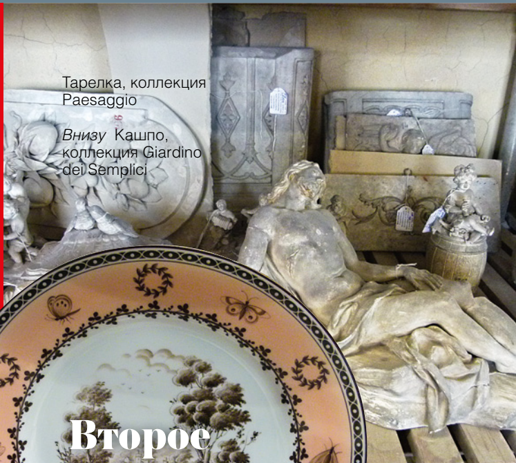
Тарелка, коллекция Paesaggio

Даже производство располагается в городке Мариано. Изначально компания специализировалась на офисной мебели, и до сих пор это важная статья дохода. Так, например, в офисе марки демонстрируют 10-метровый стол для переговоров, полностью обитый кожей, а на выставке iSaloni в Милане фабрика показала другого гиганта—уже из лакированного розового дерева. В её активе также корпусная, мягкая мебель и проектные работы—обстановка частных домов.