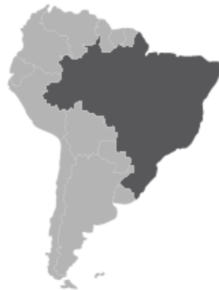
Zona di provenienza dell'Elegant Dune