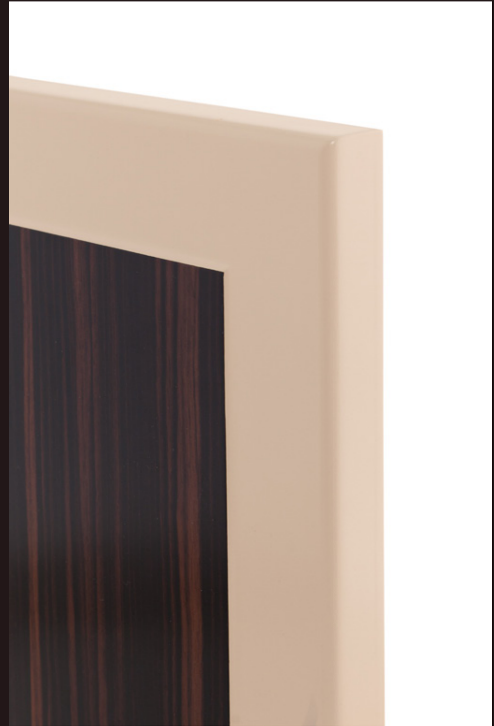
Anta Elegant, che abbina legno e laccato