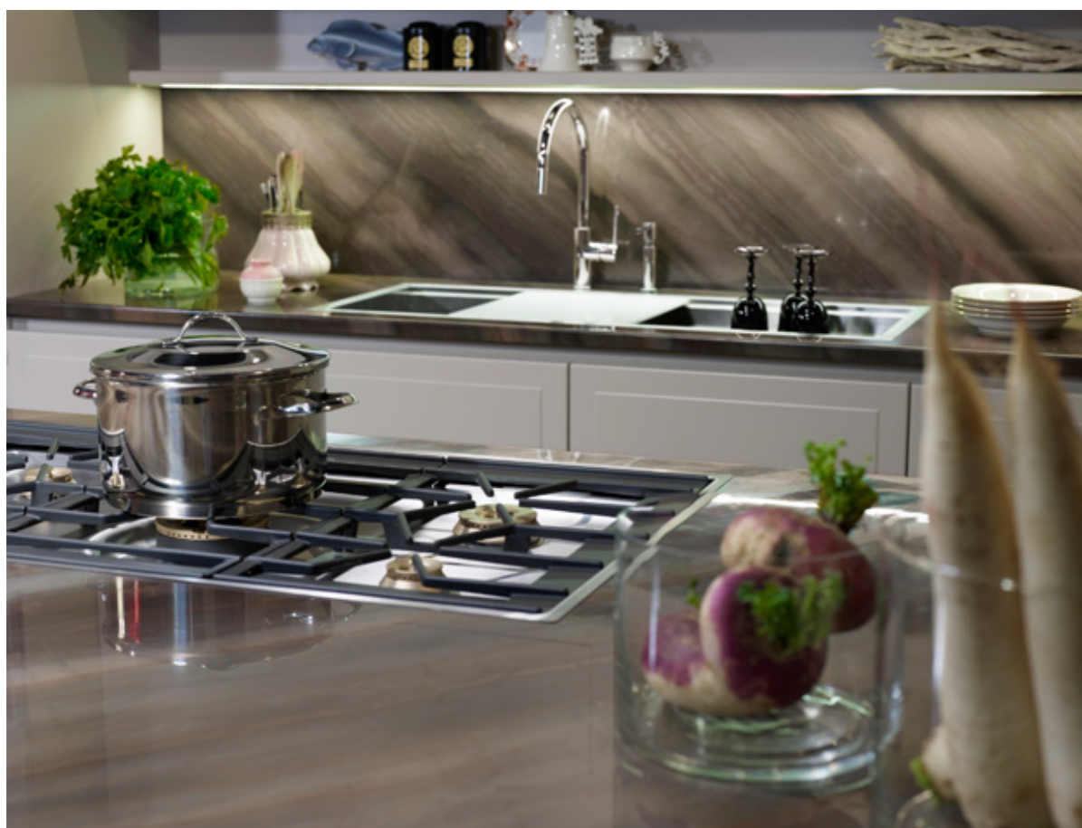
Piano di lavoro Elegant Dune