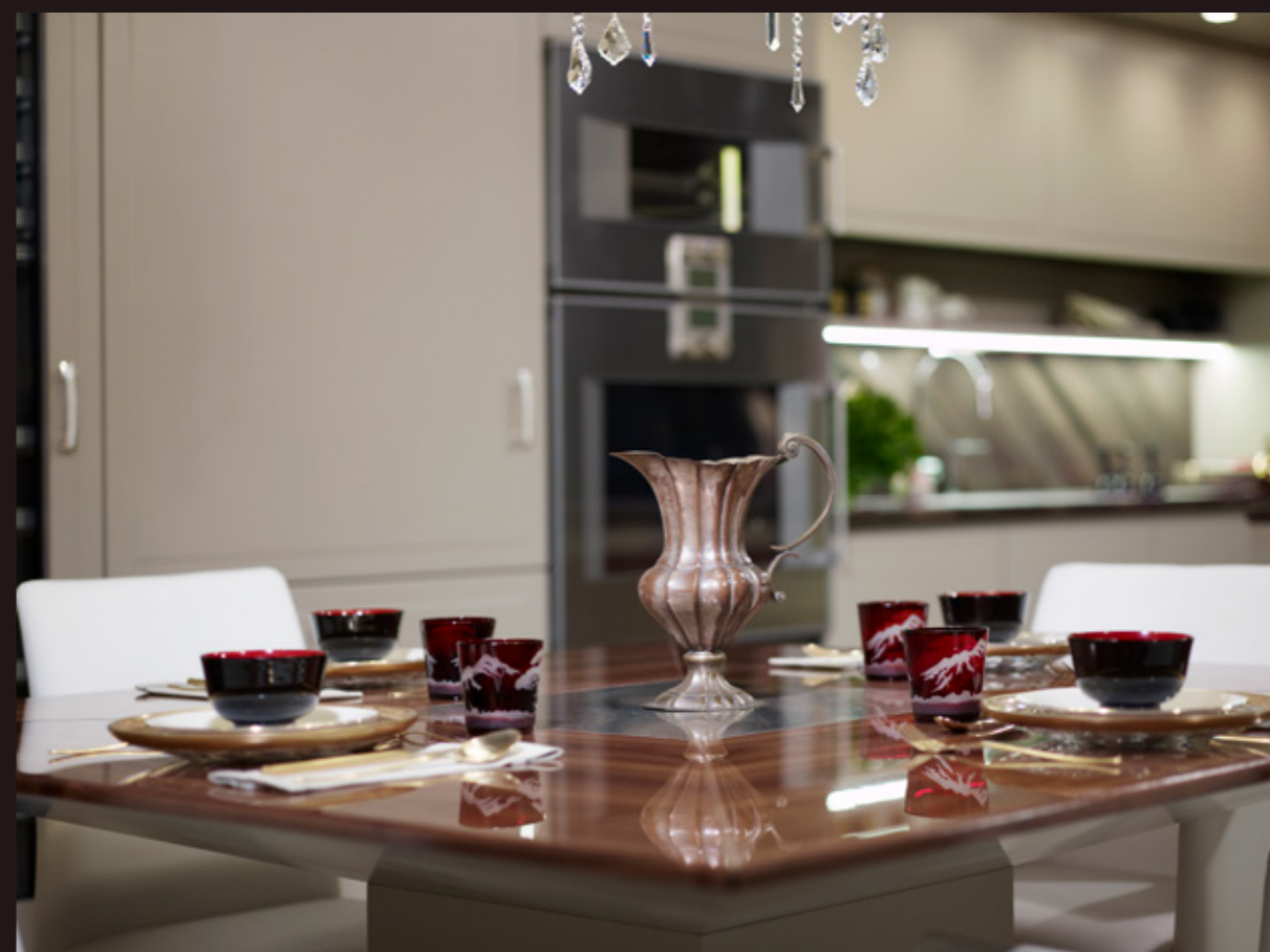
Immagine del tavolo Elegant in legno noce canaletto e inserto in Ellegant Dune