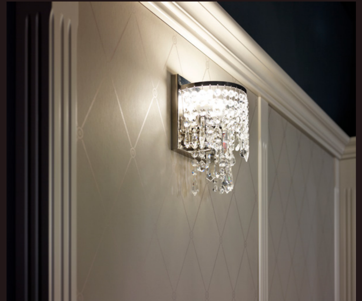
Carta da parati Cole & Son utilizzata per la collezione Elegant di Arthesi