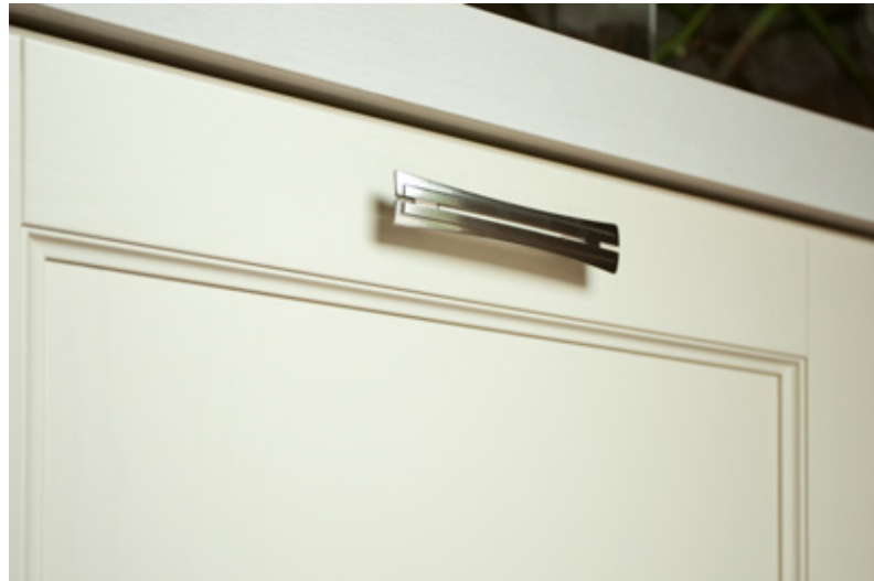
Anta tipica a telaio

Questo particolare procedimento, se da una parte permette di avere un disegno classico, dall'altra presenta una soluzione tecnologicamente innovativa che permette di abbinare legno e laccatura a campione per permettere una grande personalizzazione.